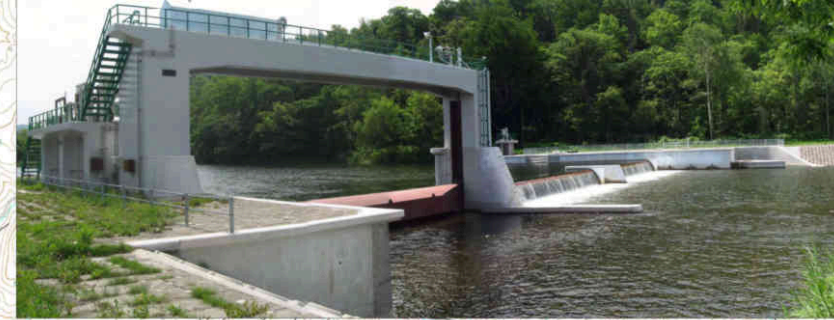
③士別川頭首工 Shibetsugawa Head Works