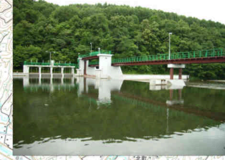
⑤剣和頭首工 Kenwa Head Works