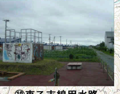
⑲東乙支線用水路 Tou-Otsu lateral Canal