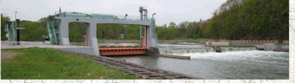
⑦下士別頭首工 Shimoshibetsu Head Works