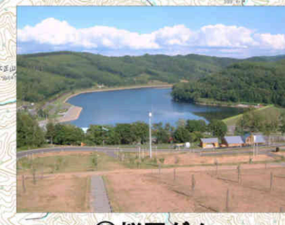
⑬桜岡ダム Sakuraoka Dam