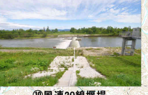
⑩風連20線堰堤 Furen 20-sen Head Works