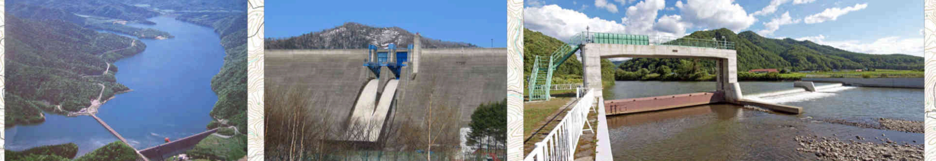
①岩尾内ダム (全景) Iwaonai Dam (bird's eye)