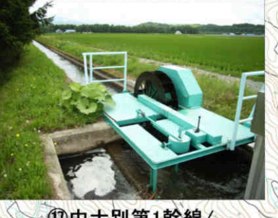
⑰中士別第1幹線/士別川第2幹線 水車 Waterwheel in Nakashibetsu No.1 Main Canal/Shibetsugawa No.2 Main Canal