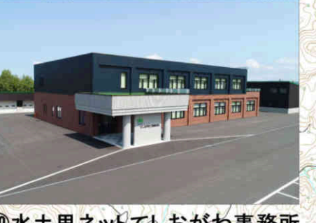
⑳水土里ネットてしおがわ事務所 Teshiogawa LID Office