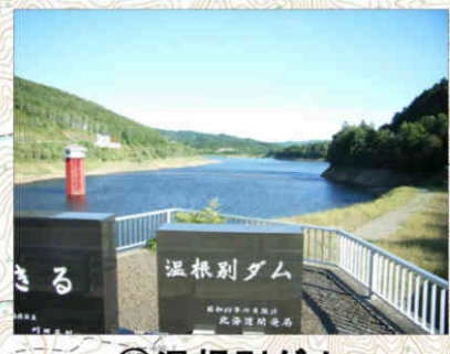
⑫温根別ダム Onnebetsu Dam