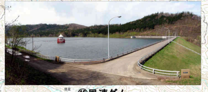
⑯風連ダム Furen Dam