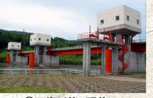
⑨天塩川第2頭首工 Teshiogawa No.2 Head Works