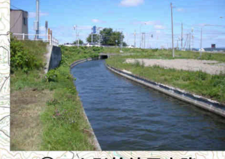
⑧下士別幹線用水路 Shimoshibetsu Main Canal