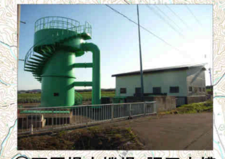
⑭西原揚水機場・調圧水槽 Nishihara Pump Station/Surge Tank