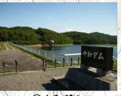
⑪中和ダム Chuwa Dam