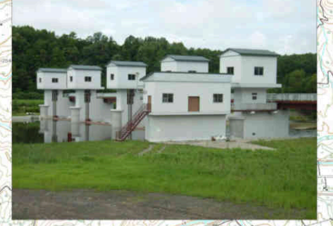
⑥天塩川第1頭首工 Teshiogawa No.1 Head Works