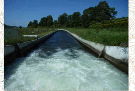
④士別川幹線用水路 Shibetsugawa Main Canal